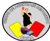
Figura 1. Logo que identifica al Grupo de Arbitraje Deportivo en WhatsApp (Rivera, A. 2020)

Con la creación del Grupo WhatsApp de Arbitraje Deportivo en tiempos del Covid-19 se logra vincular a estudiantes de licenciatura, maestría y doctorado de varias provincias del país: Mayabeque, Artemisa, La Habana, Matanzas y Las Tunas, todos investigan en el tema del arbitraje deportivo. A partir de su creación el 7 de abril de 2020 funciona con un alto nivel de aceptación, transparencia y colaboración.